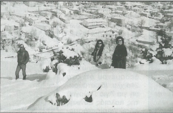
Φωτογραφία του χιονισμένου χωριού μας, που δύσκολα διακρίνεται. Όμως το να το βλέπεις από το "τσιουκάκι αλώνι" ήταν ένα πανόραμα χάρμα ομορφιάς.

Κακοκαιρία και βαρυχειμωνιά ήταν τα χαρακτηριστικά του φετινού χειμώνα για το χωριό μας, για την ευρύτερη περιοχή της Επαρχίας Δομοκού και γενικότερα όλης της χώρας.